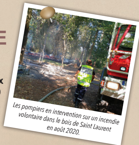
Les pompiers en intervention sur un incendie volontaire dans le bois de Saint Laurent en août 2020.

Depuis 2019, la réglementation sur la défense incendie impose aux communes de l'Eure d'avoir un point d'eau incendie à moins de 200 mètres de chaque habitation. Corneville, comme de nombreuses autres communes, doit se mettre en conformité afin d'assurer la sécurité de chacun d'une part et le développement urbain d'autre part.