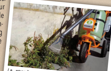
La nouvelle génération de désherbeur thermique RIPAGREEN® permet de créer un choc thermique rapide sur 40cm, éclatant ainsi la partie chlorophyllienne du végétal. Le processus de photosynthèse est alors stoppé. La plante se dessèche ensuite naturellement avec un résultat visible au bout de quelques jours.

À noter que la commune a posé 5 cavurnes supplémentaires ainsi qu'un nouveau bloc au colombarium avec 6 cases.