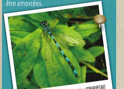
Agrion de Mercure

L'objectif de cet atlas est de disposer de toutes les données du patrimoine naturel local pour la mise en place de politiques locales adaptées. En parallèle, des actions concrètes de préservation ou de reconquête de la biodiversité pourront être amorcées.