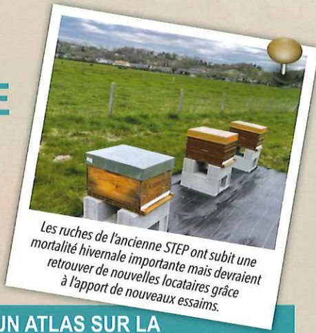
Les ruches de l'ancienne STEP ont subi une mortalité hivernale importante mais devraient retrouver de nouvelles locataires grâce à l'apport de nouveaux essaims.