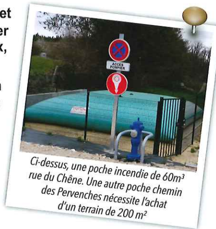
Ci-dessus, une poche incendie de 60m 3 rue du Chêne. Une autre poche chemin des Pervenches nécessite l'achat d'un terrain de 200 m 2

■ Concessions : 30 ans 92 € / 50 ans 153 € ■ Colombarium : 15 ans 670 € ■ Cavurnes : 15 ans 250 € ■ Jardin du souvenir : Gratuit