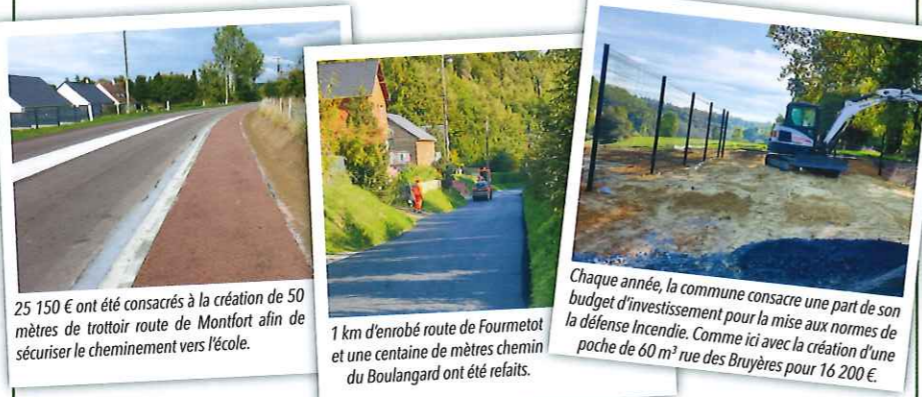
25 150 € ont été consacrés à la création de 50 mètres de trottoir route de Montfort afin de sécuriser le cheminement vers l'école.

Les investissements, inscrits au budget 2022, ont tous été réalisés. Réfection de voirie, défense incendie, enfouissement de réseaux, changement d'huissieries à l'école... Retour en images sur les principales réalisations de l'année.